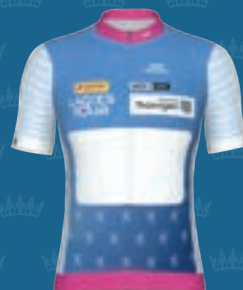
GERMAN QUEEN FREISTAAT THÜRINGEN