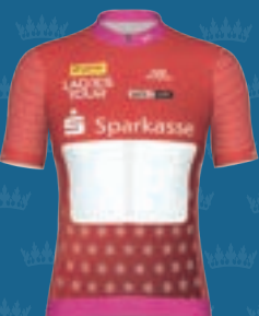
YOUNG STAR SPARKASSE