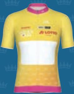
TOUR QUEEN LOTTO THÜRINGEN