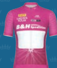
SPRINT QUEEN B & H SPEDITION