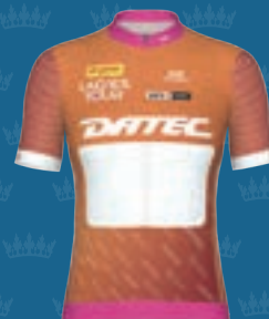
ATTACK QUEEN DATEC