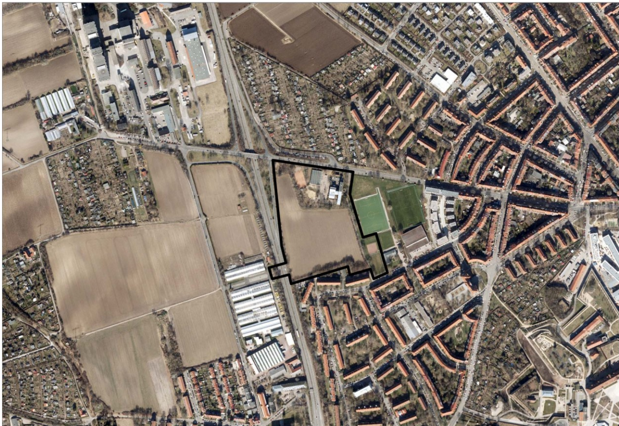
Abbildung 2– Luftbild ohne Maßstab, Quelle: Amt für Geoinformation und Bodenordnung, Stand: 2022

Im nördlichen Teil im Plangebiet befindet sich südlich der Blumenstraße gelegen das Gelände der Europaschule (Jacob-und-Wilhelm-Grimm-Schule, GS 8), bestehend aus dem