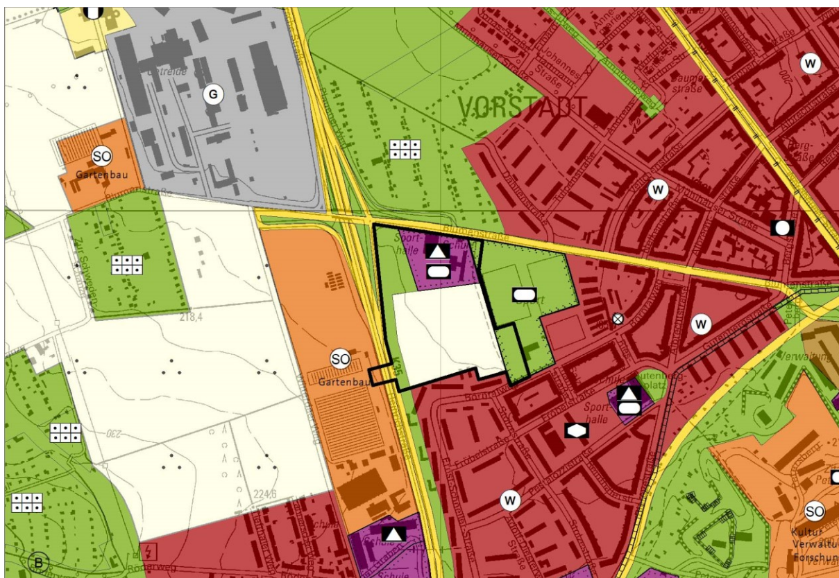
Abbildung 3 - Auszug wirksamer FNP

Entwicklungsachsen – Die Entwicklung der Bauflächen vollzog sich bisher innerhalb der traditionellen Entwicklungsachsen nach Norden sowie nach Süden. Der FNP zeigt neue Entwicklungsachsen nach Osten und nach Westen. Gründe für diese Neuorientierung sind neben den oben beschriebenen regionalen Rahmenbedingungen die beschränkten Entwicklungsmöglichkeiten innerhalb der traditionellen Achsen sowie die Ineffektivität einer weiteren bandartigen Ausdehnung nach Norden und Süden (...).