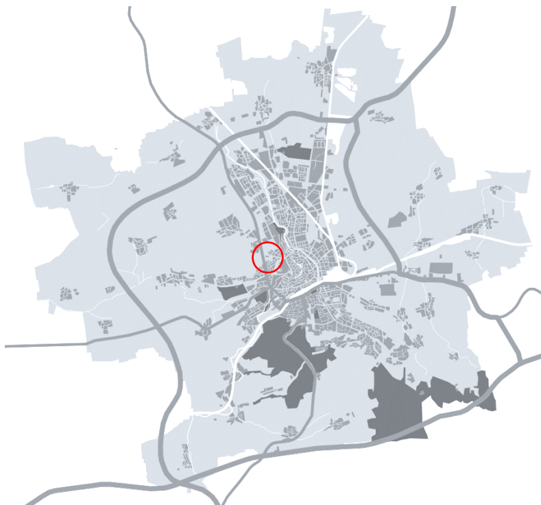
Abbildung 1- Schemakarte zur Lage im Stadtgebiet

Die vorliegende 52. Änderung des FNP für den Bereich Andreasvorstadt „Südlich Blumenstraße/ Östlich Heinrichstraße – Erweiterung Schulstandort Blumenstraße“ soll im Vollverfahren nach § 2 BauGB durchgeführt werden, somit muss auch ein Umweltbericht erstellt