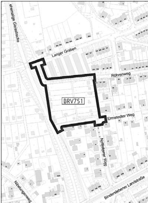
Zur Drucksache 0830/24