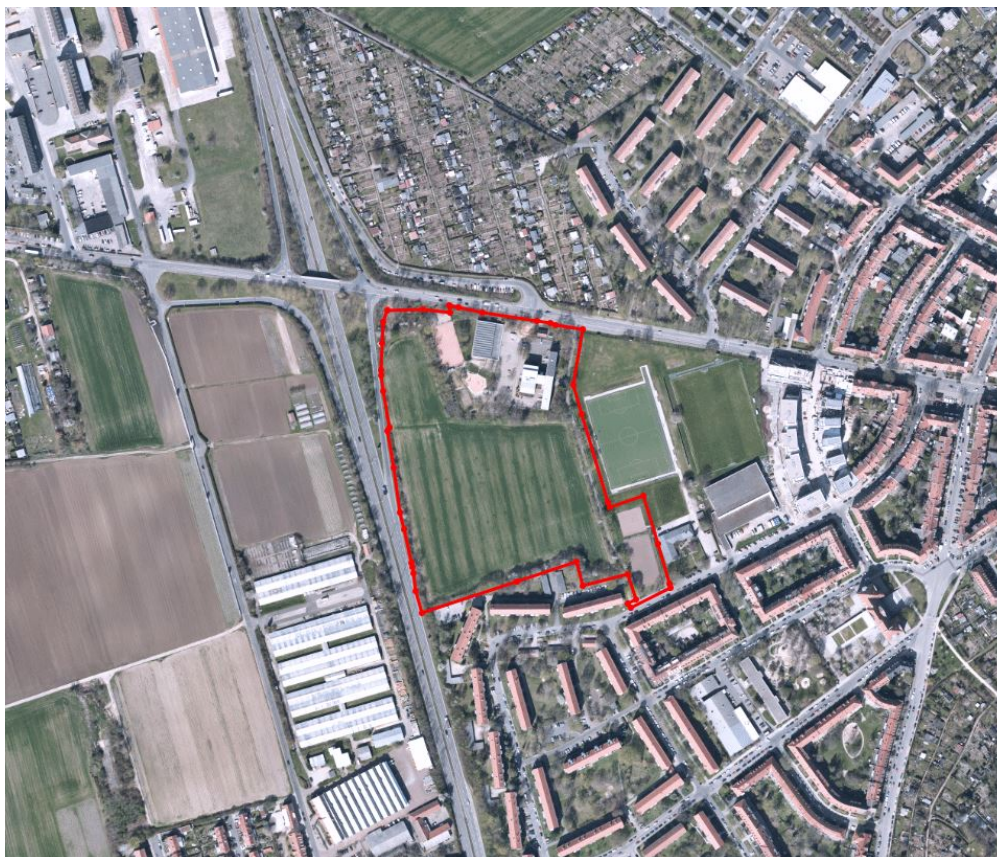
Luftbild Umgriff Planungsgebiet