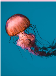
Grafik: Julia Lieder