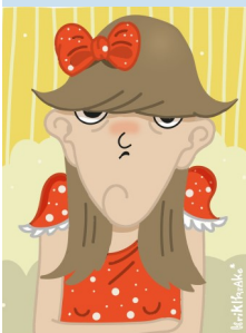
Grafik: Janine Naue

Spielen ohne Zeitdruck – beim Langen Spieleabend XXL erwartet Sie eine große Auswahl an Brett-, Karten- und Gesellschaftsspielen für alle Altersgruppen. Ob Strategie, Geschick oder Teamwork – hier ist für jeden etwas dabei! Kommen Sie vorbei, spielen Sie mit und genießen Sie einen geselligen Abend in entspannter Atmosphäre.