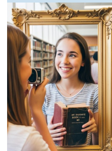
Grafik: Matthias Lange via www.canva.com

Es erwarten euch eine Vielzahl spannender XXL-Spiele. Testet eure Geschicklichkeit bei „Maxi-Domino“, „XXL-Leiterspielen“ oder „XL-Mühle“ und habt Spaß mit klassischen Spielen in Übergröße. Ob allein oder gemeinsam – hier können sowohl kleine als auch große Entdecker ihre Fähigkeiten unter Beweis stellen. Kommt vorbei und erlebt die Faszination von Spielen in XXL-Format!