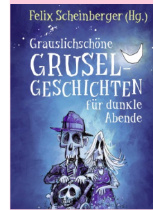
Cover: Fischer Sauerländer GmbH

In diesem Kamishibai-Theaterstück erwacht Hugo vom Topfe, das älteste Gespenst mit 963 Jahren, auf der Burg Hirnsberg. Gemeinsam mit drei weiteren Gespenstern muss er alles für die Gespensterparty vorbereiten. Doch wo sind die anderen? Die verwinkelte Burg birgt viele Geheimnisse, und die Eingangshalle ist ein Chaos! Werden sie rechtzeitig fertig, bevor um Mitternacht die Gäste eintreffen?