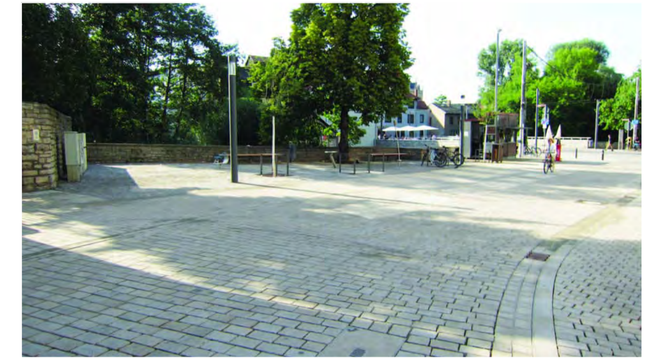
Beispiel passend zur dargestellten Ausführung in Grosspflasterbauweise mit unterschiedlich bearbeiteten Steinseiten: Barfüßerstrasse Erfurt, Blick Richtung Nordosten